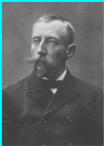
Norský polárník Roald Amundsen 14. prosince 1911

Angličan Robert Falcon Scott O měsíc později. Na zpáteční cestě zemřel.